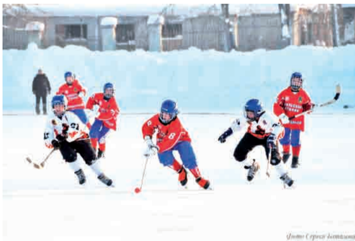
Момент матча первого турнира: «Трубник» - «Кузбасс» (Кемерово)

Они-то и поспорят за Кубок Патриарха 20-23 января в финале второго розыгрыша. С учётом того, что Первоуральск при посредничестве руководства ХК «Уральский трубник» прошлой зимой отлично справился с организационными задачами, нам вновь доверено принять этот необычный турнир. На сей раз клюшки на уральском льду скрестят восемь мальчишеских команд 2000-2001 г.р.