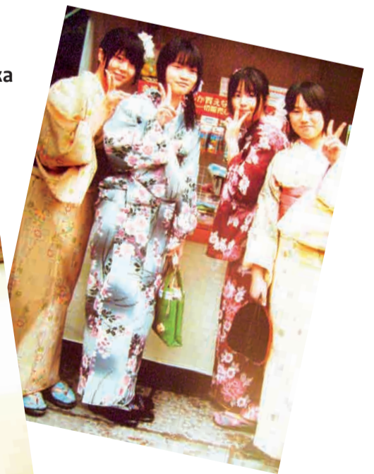
Японские мгновения Виталия Дубских. Его фотовыставка “Красная Япония” расскажет нам о Стране Восходящего Солнца и должна открыться в февралемарте наступившего года в городском выставочном центре на Вайнера.