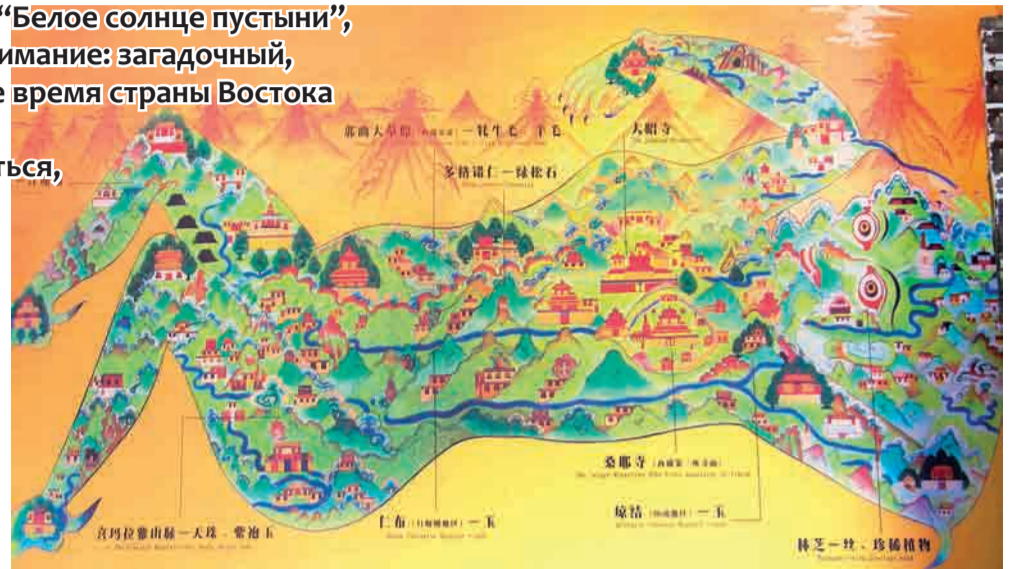
Карта Тибета, изображенная в виде демоницы. По легенде, если она встанет, то на всей земле начнутся катаклизмы. А сдерживают демоницу храмы, которых в Тибете очень много.

- Одной женщине, приехавшей из Казахстана, отказали, не объяснив причины. Ей пришлось уехать несолоно хлебавши. Обидно!