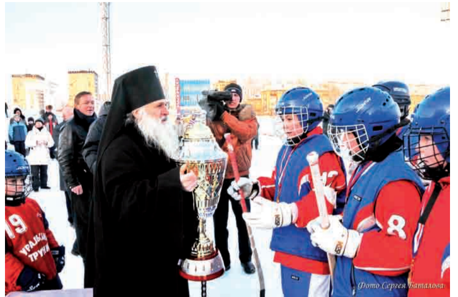
Февраль 2011 года. Владыка Викентий вручает Кубок Патриарха ребятам «Уральского трубника»

На церемонии закрытия архиепископ владыка Викентий пригласил ребят «Трубника» в свободное от учёбы и ледовых баталий время посетить подворье епархии. И поездка туда