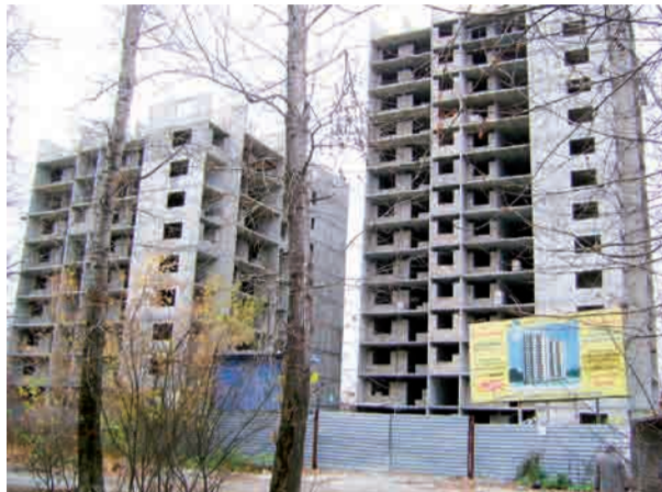
Ипотеку на рекламном щите предлагают. А вот строительство этих 16-этажек «заморозили»

А чему теперь удивляться? Это и есть последствия той самой грабительской, преступной и недаленовидной политики, которую народ метко назвал приватизацией. И о которой не любят вспоминать сегодня там, в белокаменной, - ни чужайсы, ни «двое на велосипеде».