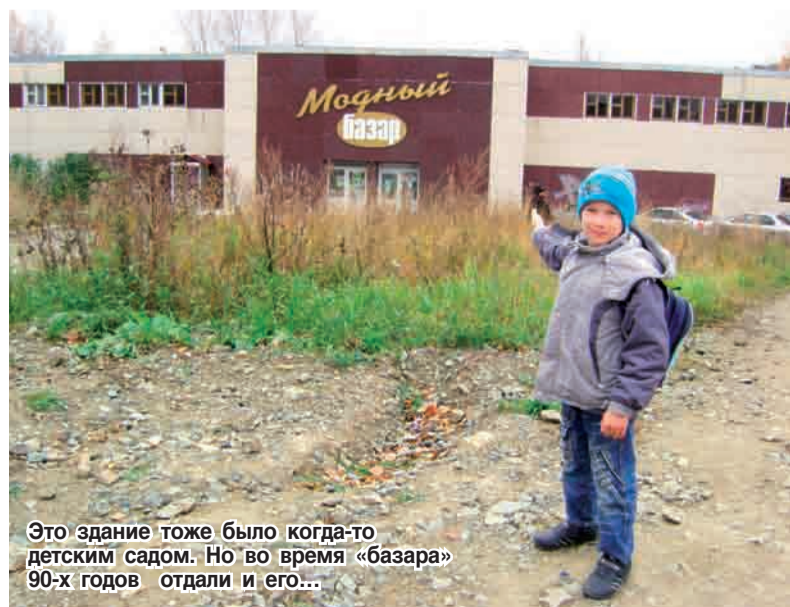
Это здание тоже было когда-то детским садом. Но во время «базара» 90-х годов отдали и его...