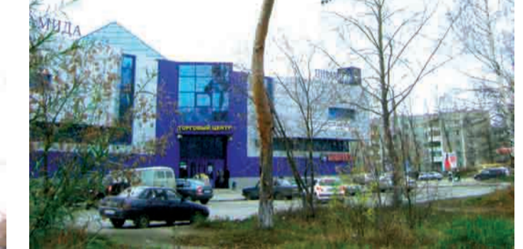
Последняя сосна на улице Трубников