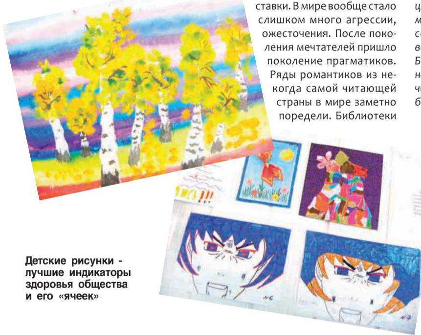
Детские рисунки - лучшие индикаторы здоровья общества и его «ячеек»