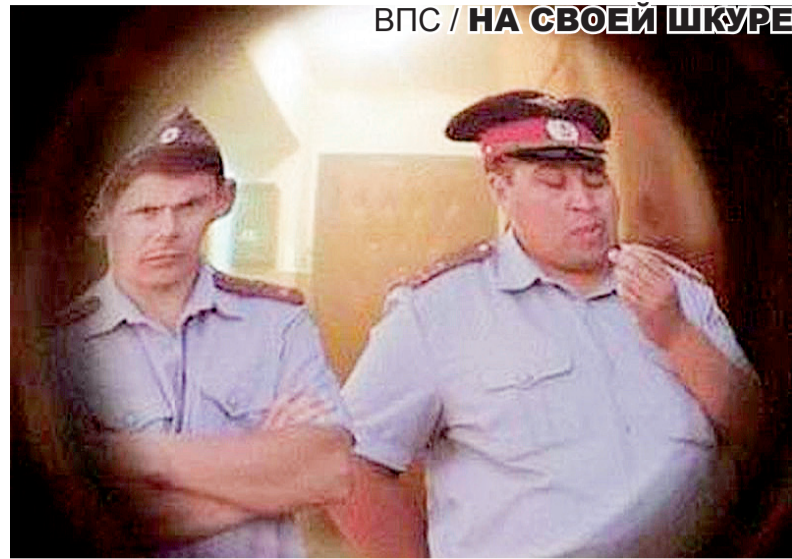
ВПС / НА СВОЕЙ ШКУРЕ

Следователи извлекают черную коробку с надписью “анархия”, изучают содержимое. Еще одна коробка забита шевронами (нашивками) разных родов войск. Записную книжку “Живу в России – горжусь