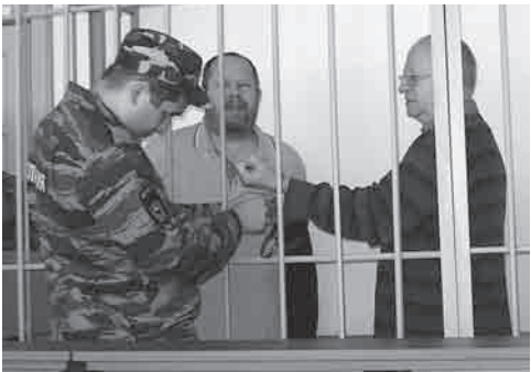
«Коллекционерам» «светит» реальный срок

Видимо, эти непростые вопросы озадачили и судью. Приговор в итоге получился строгим: