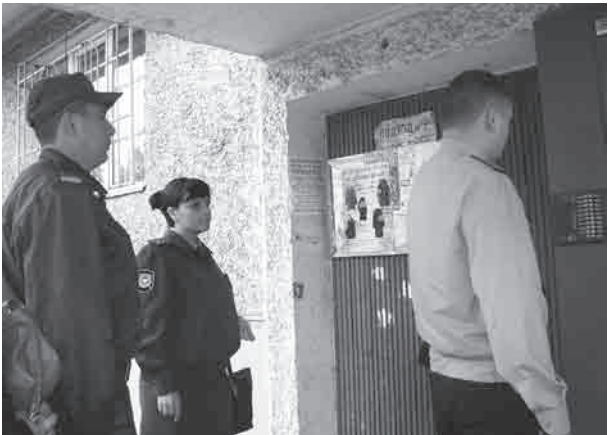
Попасть в квартиру должника - задача не из простых

- Заходишь к ним домой – на пороге встречаются, улыбаются, или квитанцию показывают, что уже оплатили, или обещают внести деньги в определённый срок. Боятся, что машину опишут. Ответственные и в целом порядочные люди, как правило, работающие, - рисует А.Гребнев портрет типичного должника гаишников. - Правда, и среди таких неплательщиков наглые попадаются. Как-то пришёл к одному парню, показал «запылившийся» штраф,