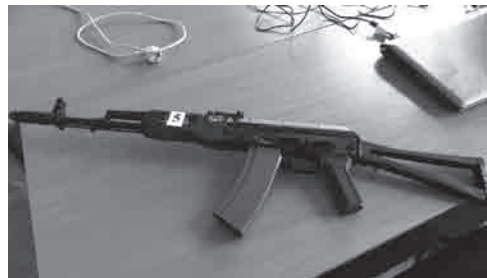
Лазерный автомат для электронного тира