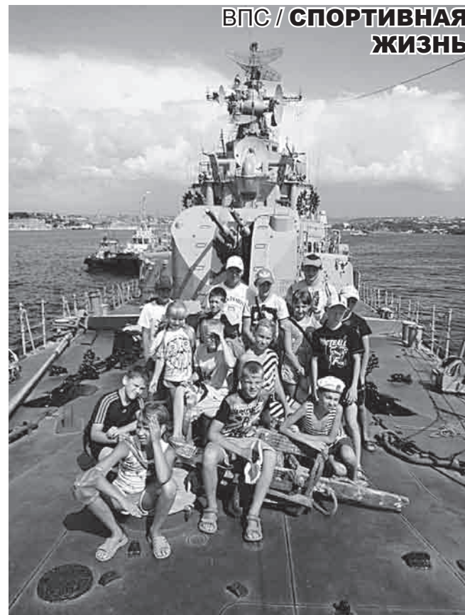
На борту СКР «Сметливый»

В итоге путешественники поселились в мини-гостинице со всеми удобствами (и, кстати, небольшой платой за питание и проживание - 500