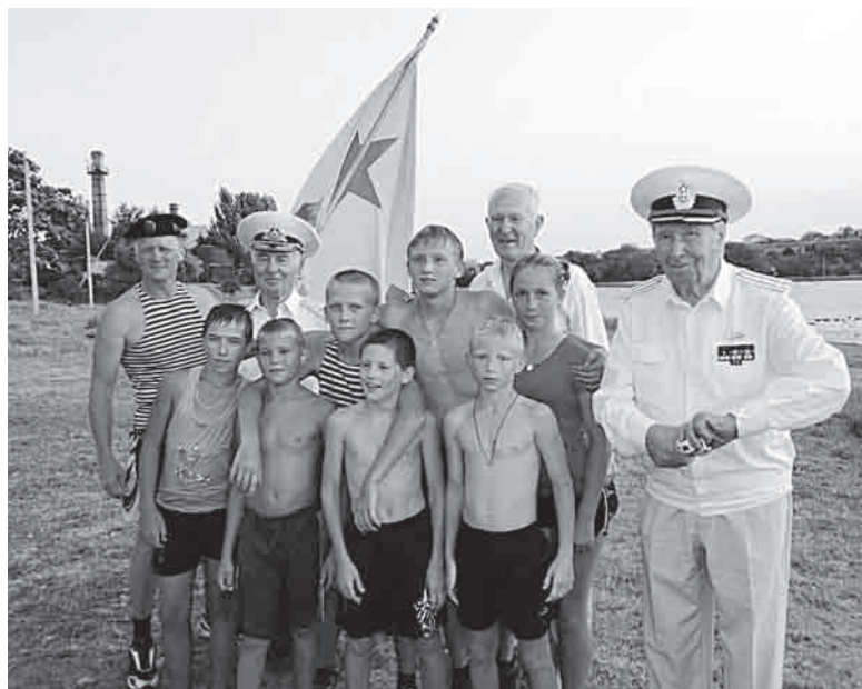
С ветеранами морской пехоты СССР

В учебно-тренировочных сборах в Севастополе приняло участие 28 человек, в том числе: руководитель (тренер) – 1 чел.; тренер – 1 чел.; врач – 1 чел.; Спортсмены: СК «ДИНУР» - 19 чел.; ДЮСШ управления образования – 5 чел.; ДЮСШ г. Сухой Лог – 1 чел.