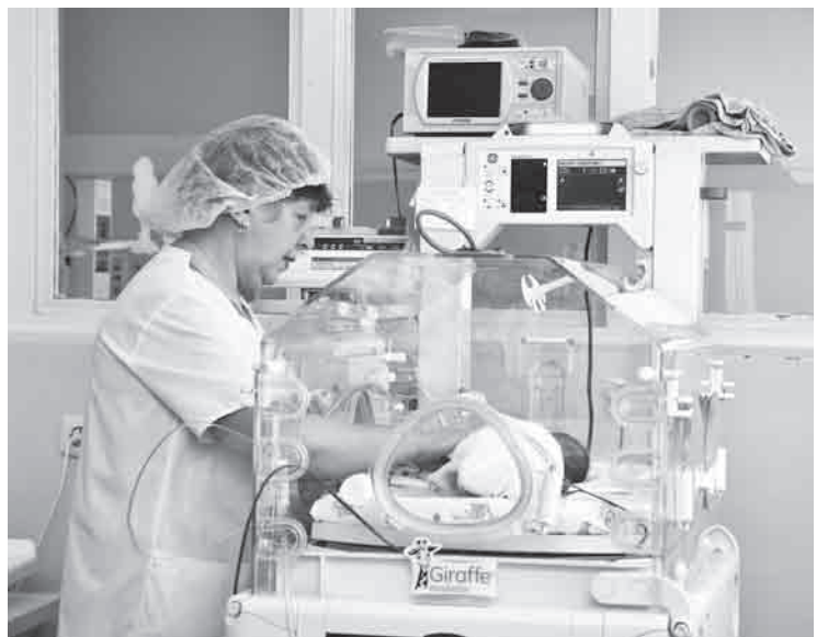
В перинатальном центре есть всё необходимое оборудование для выхаживания младенцев

Прошло время, нынче мы созвонились с Шайдуровым, и я приехал посмотреть, что же сделано реально. Тем более что в этом родильном доме у меня 27 лет назад родилась дочка, в этом же роддоме появились на свет два внука, здесь же я как-то раз вручал коляски роженицам к Дню города. В общем, мне это было интересно.