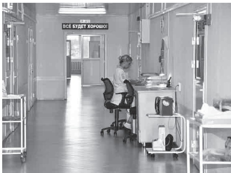
Девиз Первоуральского перинатального центра «Всё будет хорошо!»

Вообще-то я очень настороженно отношусь к медицинским преобразованиям в стране, считаю, что, по большому счёту, реформа в медицине провалилась, люди страдают от нехватки мест в поликлиниках, от того, что всё платно. Я это прекрасно понимаю, но родильное отделение в Первоуральске меня порадовало. Все, кто имеет отношение к появлению на свет маленького человечка, все эти люди понимают свою ответственность и делают всё от них