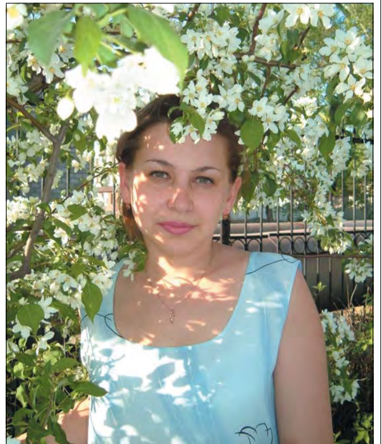
«И вот она пришла, красавица Весна». Автор Елена Шатова.