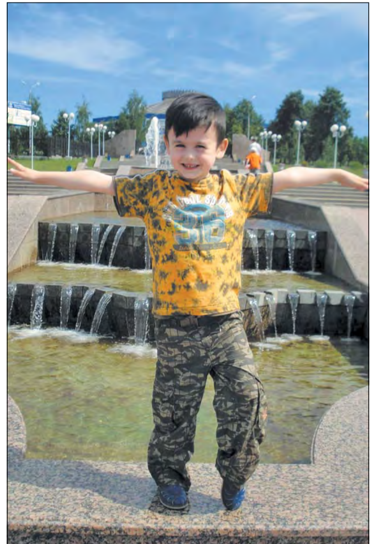
«Коренной тагильчанин». Автор Лариса Комарова.