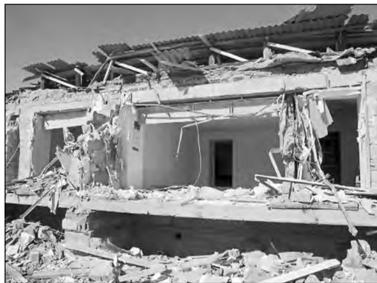
Это не последствия теракта, а офис ООО «СТС» через несколько минут после начала погрома.

Проще говоря, проигравшее битву с местным административным ресурсом руководство «СТС» попросило суд о последней милости – дать отсрочку на год для цивилизованного демонтажа строений. Для положительного решения вопроса нужно было лишь предоставить несколько необходимых документов. Мэрия при этом имела