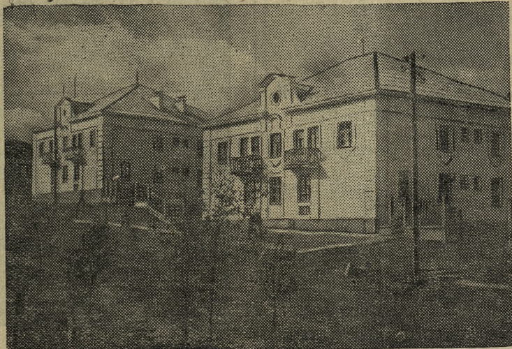
НА СНИМКЕ: новые дома.

Представленные фотографии рассказывают о руководящей роли Коммунистической партии нашей страны с первых дней создания Советского государства и до настоящего времени, как трудящиеся Советского Союза под мудрым руководством верного ученика и продолжателя дела великого Ленина — товарища Сталина идут от победы к победе.