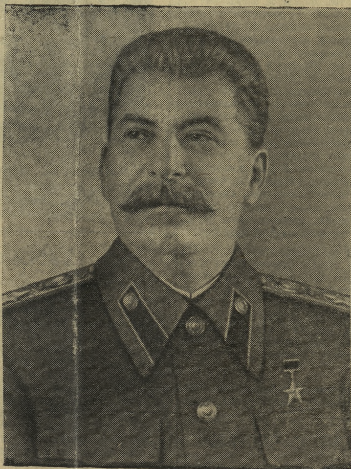
Иосиф Виссарионович Сталин