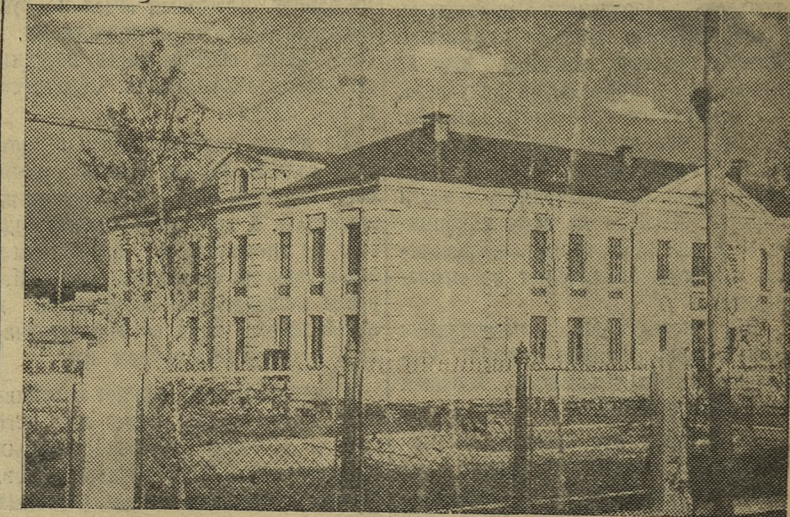
НА СНИМКЕ: здание семилетней школы № 2 в Соцгороде.