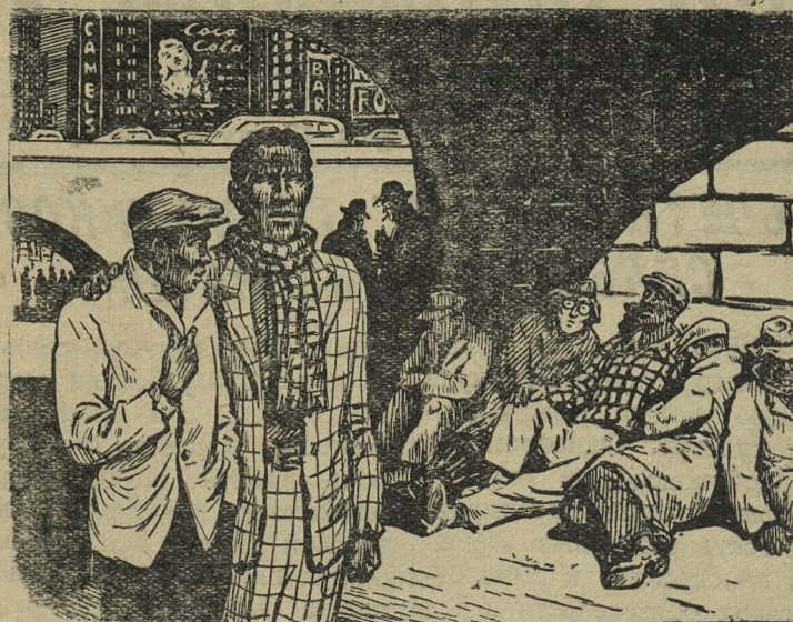
— Смотри, Джон, и в Америке есть места, где черные с белыми могут быть равноправны. Рис. С. Чистякова. Прессклише ТАСС.