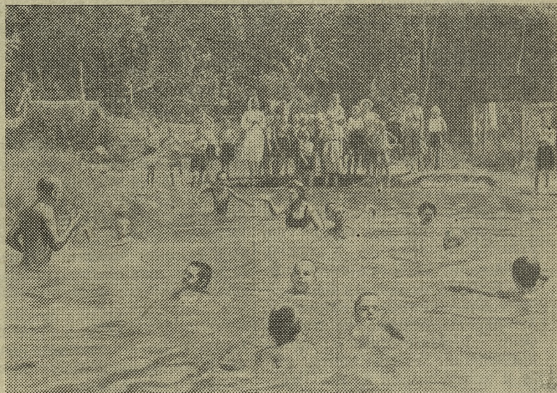
Как приятно окунуться в лагерное озеро, поплавать с друзьями. НА СНИМКЕ: пионеры отряда № 7 принимают водные процедуры.