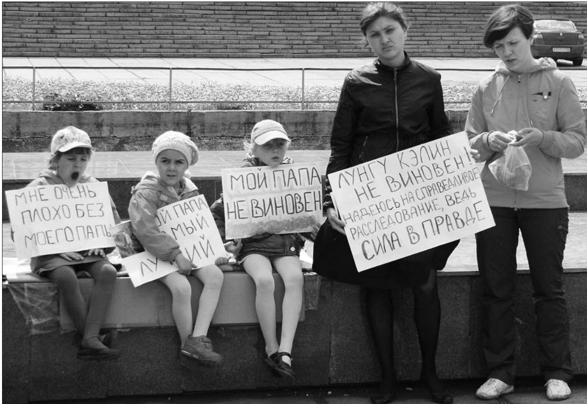
* На месте события.

3 июня в редакцию «ТР» стали поступать звонки от жителей центральной части города. Читатели интересовались подробностями событий, происходивших в тот день на площади перед КДК «Современник». Они сообщали, что тагильская семья, лишенная кормильца, устроила пикет в защиту интересов детей, отца которых посадили за решетку. Приехав на место событий, журналисты увидели такую картину.