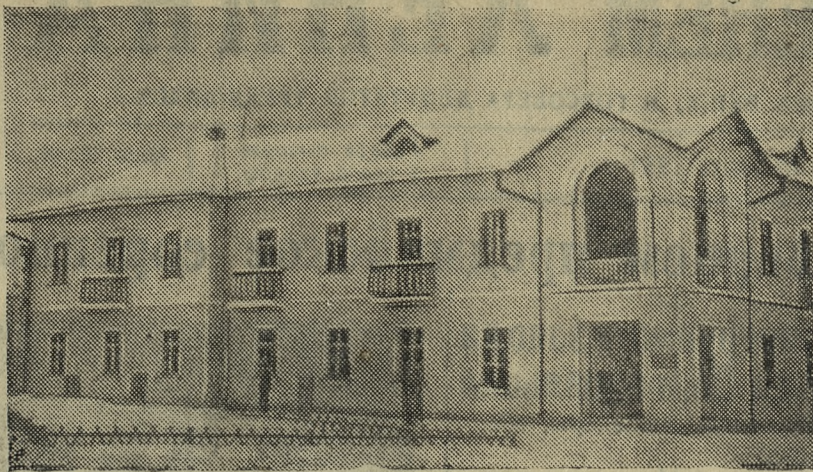
С каждым годом увеличивается жилой фонд Титано-Магнетитового рудника. В эксплуатацию вступают новые жилые дома. НА СНИМКЕ: новый 16-квартирный дом по улице Енгельса в поселке Магнитка.

Семинар руководителей профорганизаций окажет существенную помощь в работе профсоюзного актива, впервые пришедшего к руководству организациями.