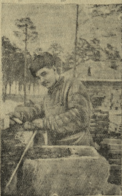
Я. Я. ФОТ — комсомолец-каменщик участка Жилстрой Уралтяжтрубостроя. В предвыборном соревновании молодой строитель свои задания выполняет на 150 процентов.