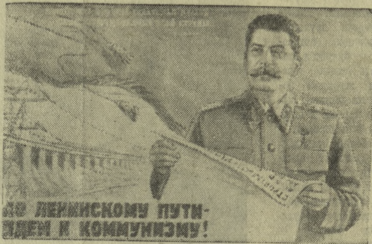
За Ленинскому пути — идею к коммунизму!

Растет культура колхозной деревни. Члены артели выписывают 110 экземпляров центральных и местных газет, журналы. Сельский клуб обогатился стационарной киноустановкой. Есть сельская библиотека. Колхозники являются ее активными читателями. Построен радиоузел. В каждом колхозном доме — электричество.