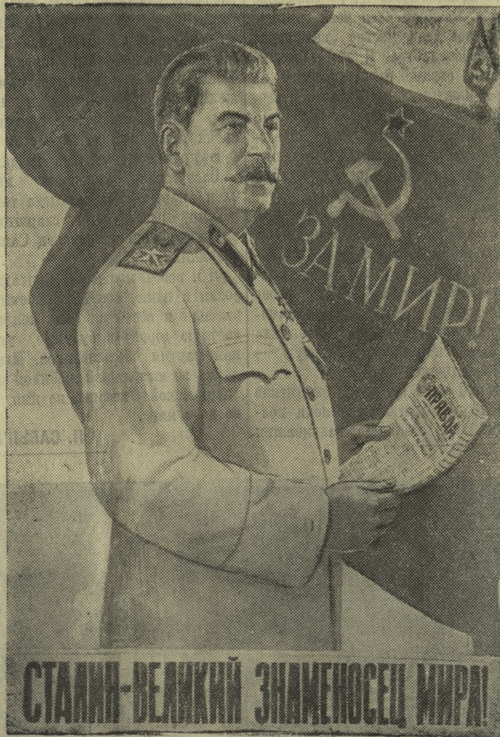
Плакат художника В. Иванова, выпущенный издательством «Искусство».

Под водительством великого Сталина, под знаменем Сталинской Конституции советский народ уверенно идет к коммунизму.