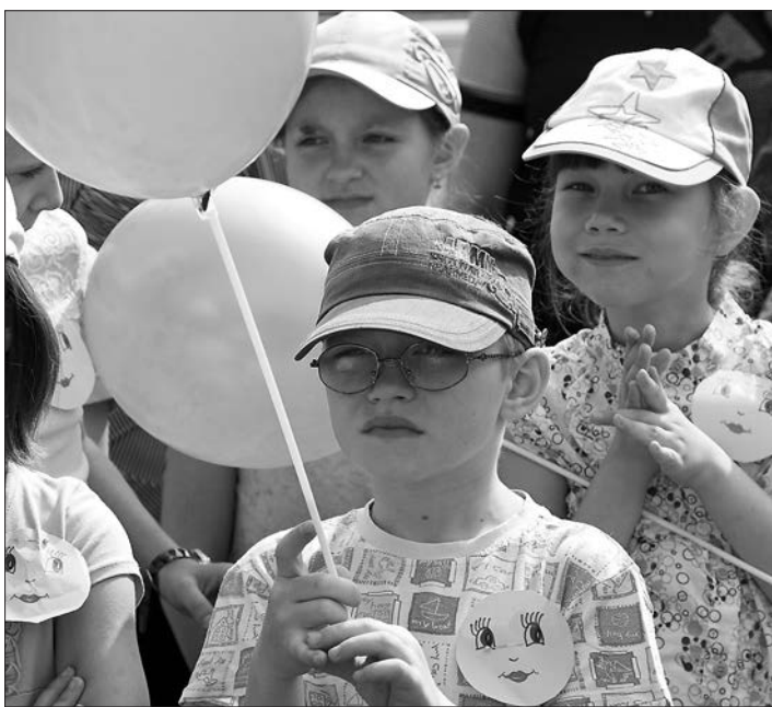
* Юные участники праздника.