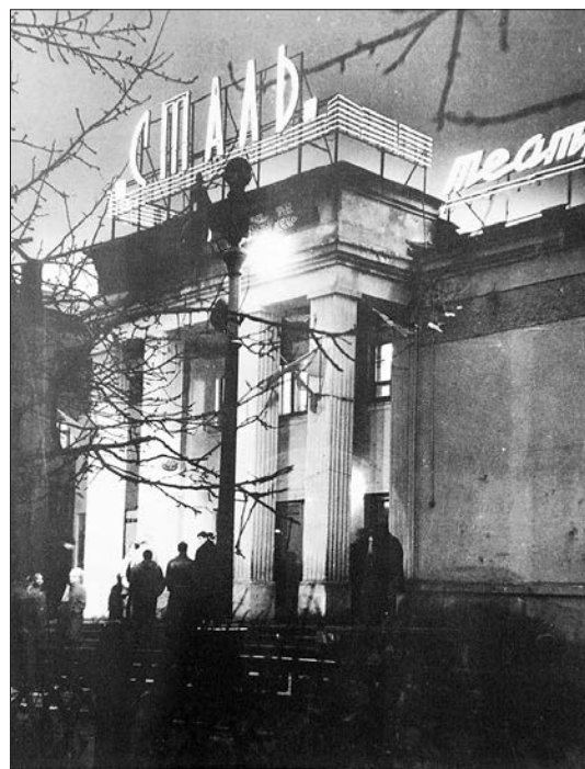
* Когда-то в Нижнем Тагиле был кинотеатр «Сталь».