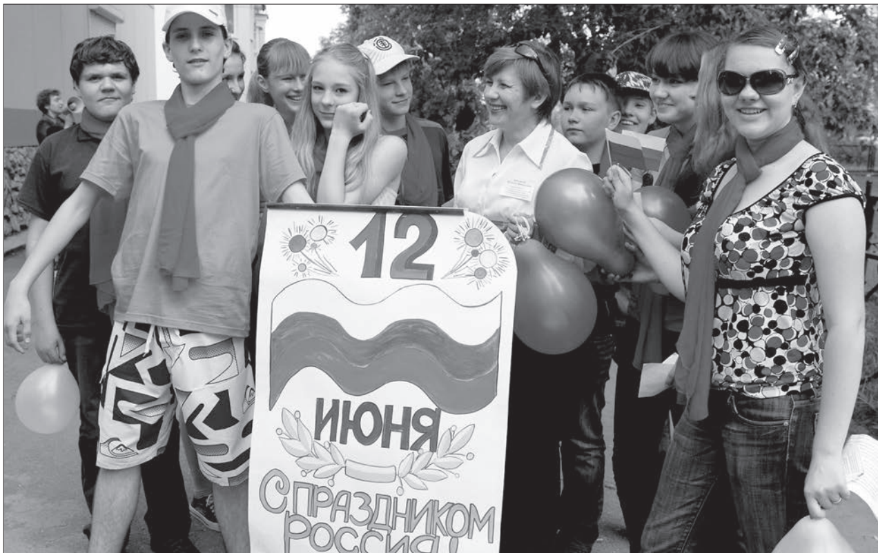
* Участники деловой игры «Государственные символы России»

В преддверии Дня России Тагилстроевская районная территориальная избирательная комиссия провела деловую игру «Государственные символы России».