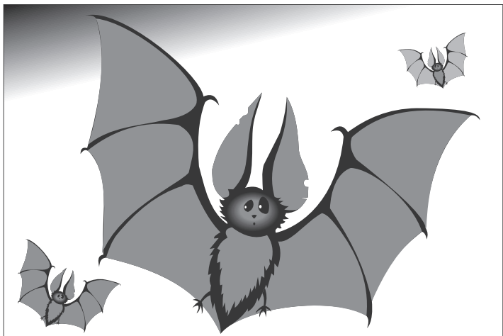
Иллюстрация Петра УПОРОВА.

Английскую церковь Святой Хильды в Северном Йоркшире, построенную в XI веке, заселила колония летучих мышей.