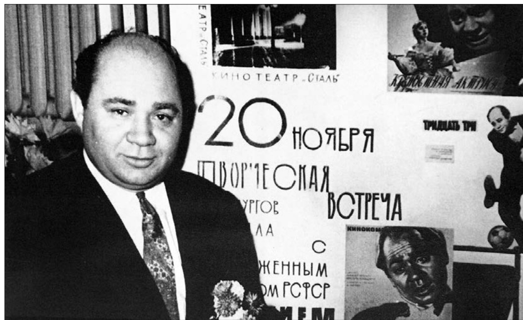
* Встреча с Евгением Леоновым.