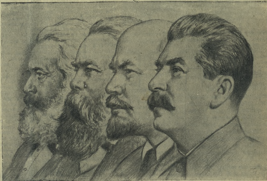
Маркс — Энгельс — Ленин — Сталин