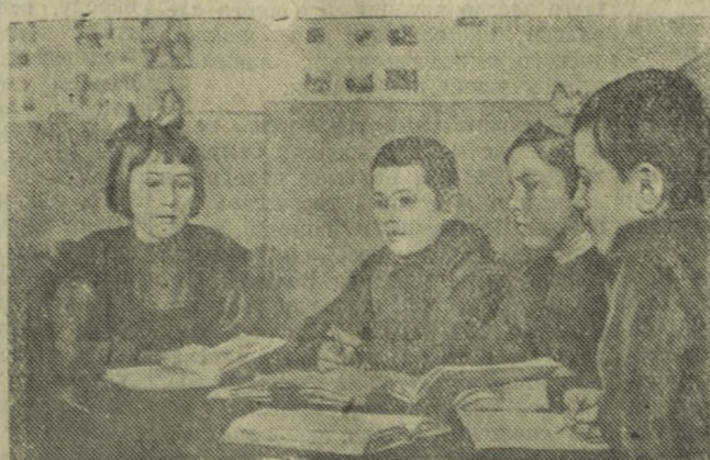
Воспитанники Первоуральского детского дома хорошо учатся в школе и тщательно готовят домашние задания.

В целях лучшей постановки учета многодетных и одиноких матерей и выдачи пособий отдел по государственному пособиям многодетным и одиноким матерям проводит обмен старых и выдачу новых книжек на получение пособий. Первого октября выдача пособий начнется по новым книжкам. Г. КЛЕЩЕВ.