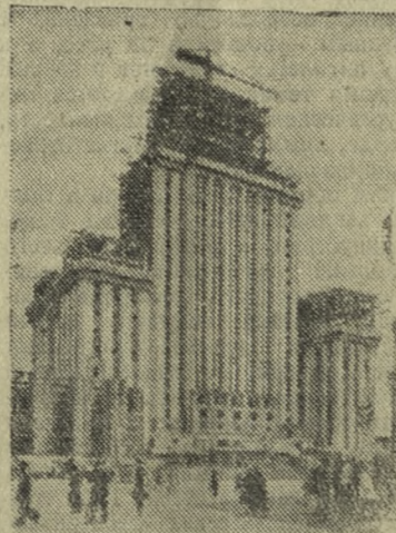
Москва. Строительство высотного административного здания на Смоленской площади.