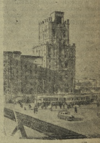
Белорусская ССР. Строительство многоэтажного здания на Бельской площади в Минске.

На 1 миллион 454 тысячи пудов больше, чем в прошлом году, засыпала в государственные закрома пшеницы хлеборобы Житомирской области.