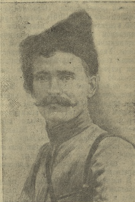
В. И. ЧАПАЕВ.

30 лет назад, 5 сентября 1919 года, на боевом посту погиб легендарный герой Гражданской войны начдив Василий Иванович Чапаев.