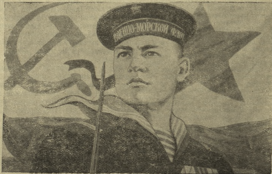
ЗАЩИТНИКАМ МОРСКИХ РУБЕЖЕЙ СОВЕТСКОГО СОЮЗА — СЛАВА! Плакат работы художника М. Соловьева, выпущенный издательством «Искусство».

Вместе со всеми Вооруженными Силами Советского Союза военные моряки зорко стоят на страже границ нашей великой Родины, строящей коммунизм под руководством великого Сталина.