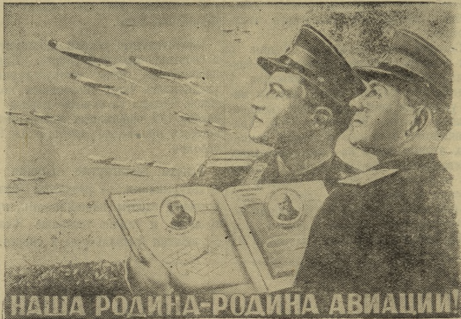
Плакат работы художников В. Корецкого и В. Гицевич, выпущенный издательством «Искусство».