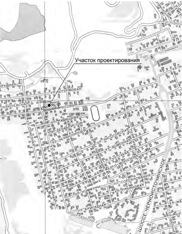
Схема размещения планируемой территории в структуре г. Н. Тагила