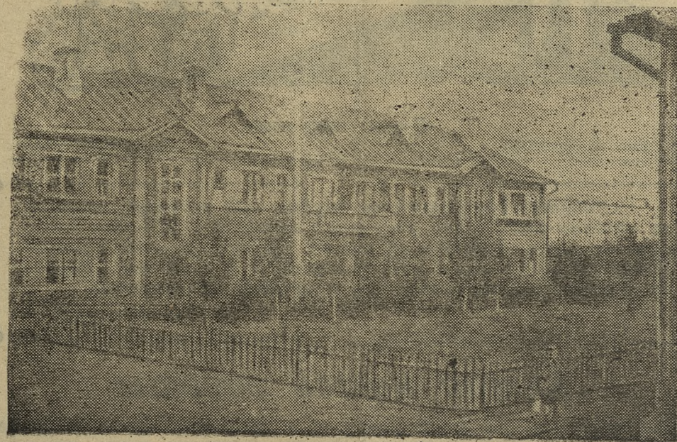
На снимке: жилой дом в 6-м квартале соцгорода Новотрубного завода имени Сталина.

Новый государственный заем даст дополнительные средства для увеличения производства товаров широкого потребления, расширения советской торговли, улучшения благоустройства наших городов и сел, строительства новых жилых домов, школ, больниц, детских садов и яслей, клубов, коммунальных предприятий.