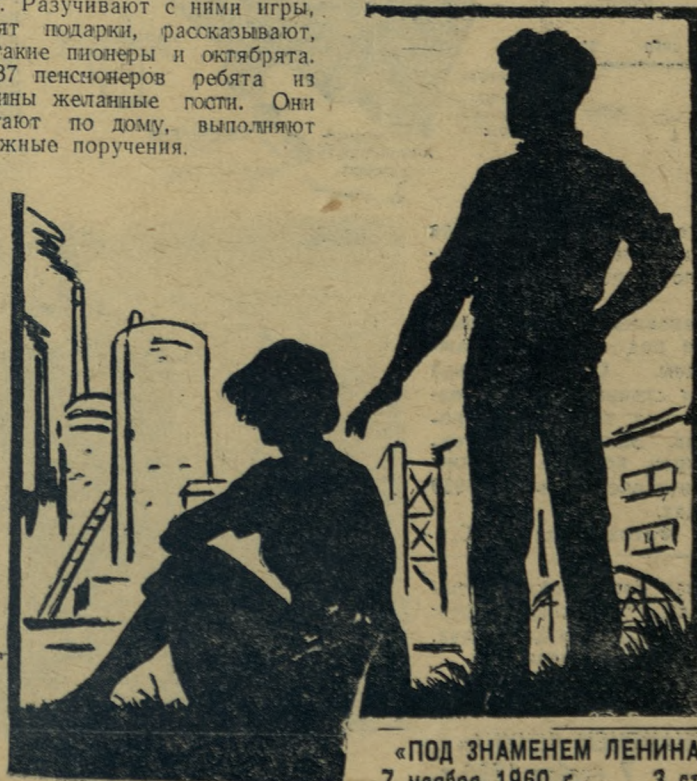
«ПОД ЗНАМЕНЕМ ЛЕНИНА» 7 ноября 1960 г. 3 стр.

Лепописью двухлетки явится альбом-эстафета, в оформлении которого заняты все отряды.