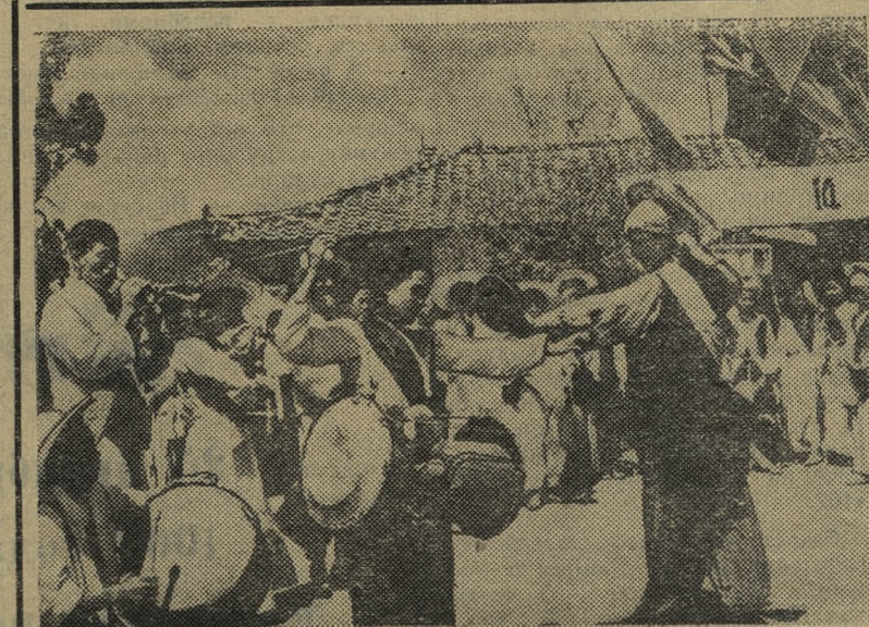
Корейская Народно-Демократическая Республика. На сельском празднике.

Астрахань. Коллектив тепловозоремонтного завода, претворяя в жизнь решения июльского Пленума ЦК КПСС, непрерывно совершенствует производство, внедряет новую технику и технологию. По проекту, разработанному на заводе, здесь пущена первая очередь испытательной станции дизелей тепловоза.