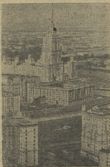
МОСКВА СЕГОДНЯ. Вид на высотное здание гостиницы «Украина» и новые жилые дома.