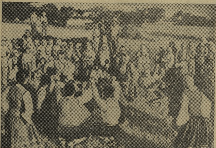
НАРОДНАЯ РЕСПУБЛИКА БОЛГАРИЯ. В горячие дни жатвы в гости к членам трудового кооператива земледель-

Глубокие изменения произошли и в области сельского хозяйства. Социалистическая реконструкция деревни, введение новых форм сельскохозяйственного производства — трудовых кооперативных земледельческих хозяйств, государственных земледельческих хозяйств и машинно-тракторных станций, а также крупные мероприятия, осуществленные партией и правительством, обеспечили значительное повышение средних урожаев сельскохозяйственных культур и продуктивности животноводства. Теперь наше кооперированное сельское хозяйство оснащено новейшей техникой, оно все полнее удовлетворяет своей продукцией растущие потребности промышленности и населения.