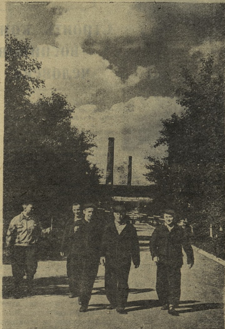
После смены трудовой. НА СНИМКЕ: Центральная аллея двора Новотрубного за- вода.