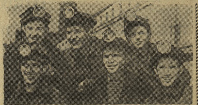
КЕМЕРОВСКАЯ ОБЛАСТЬ. 9 тысяч тонн угля сверх плана за первое полугодие выдали горняки крупнейшей в Кузбассе шахты «Коксовая-1» (г. Прокопьевск). Этот успех обусловлен автоматизацией и механизацией производства.

ИРКУТСК. (ТАСС). Новая экспедиция областного музея посвящена настоящему сокровищу Сибири. Выставка, открывшаяся электрифицированной и озвученной картой, на которой разноцветными светящимися звездочками изображены крупные промышленные предприятия и новостройки Иркутской области по образному выражению жителей — это «большое созвездие семилетки». В него входят строящиеся Братская и проектируемая Усть-Илонская ГЭС, Коршунский горнообогатительный комбинат, алюминиевый завод, мощные деревообрабатывающие заводы, гиганты строительной индустрии.