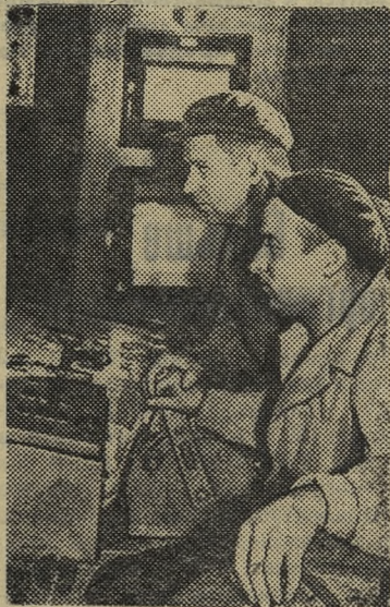
ЛУГАНСКАЯ ОБЛАСТЬ. Крепкая дружба связывает советских и болгарских металлургов.