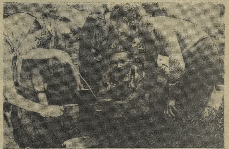
...За добавкой — в очередь.