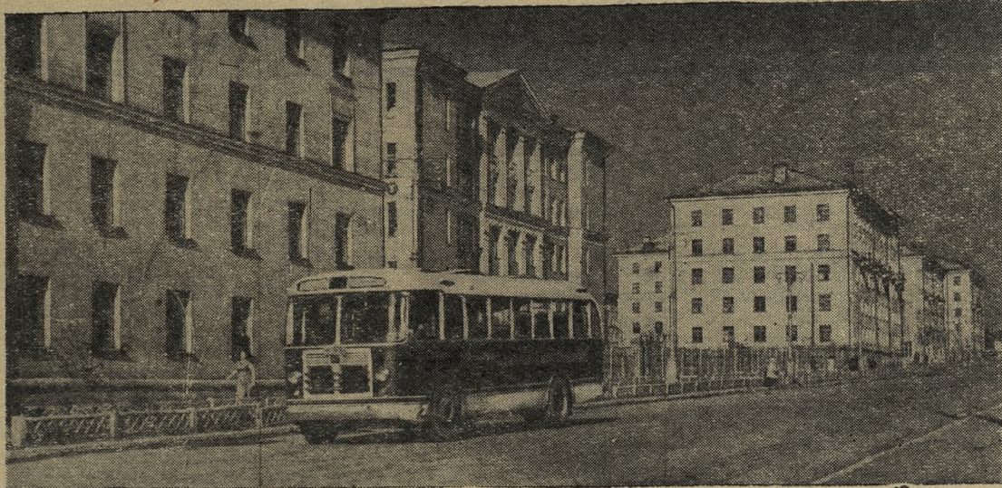
Ранним утром на улице Парковой в Соцгороде.