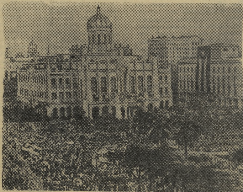
На снимке: Перед президентским дворцом в Гаване на площади Мисонес состоялся массовый митинг в защиту революционного правительства Кубы и против экономической политики правительства США.

Коллективный корреспондент редколлегия стеновой газеты «ТРУБНИК».