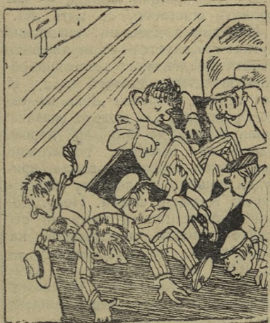
И с массовки... Рис. Е. Щеглова.