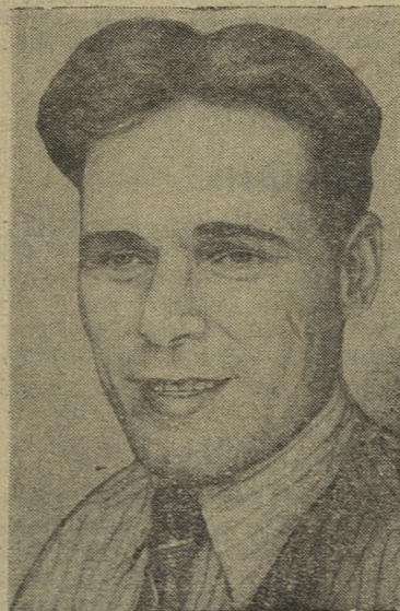
Вологжанин продолжает совершенствовать свое мастерство. Текст М. Черных, Фото А. Зияндинова.