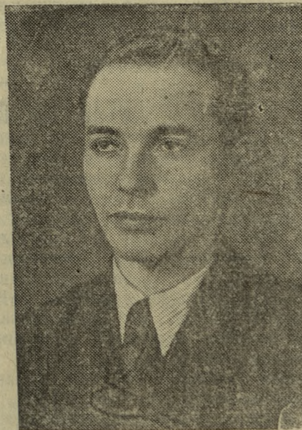
На снимке: Давид Бронштейн.

Давид Бронштейн еще совсем молодой по возрасту шахматист. Он родился в 1924 году и уже в 16 лет получил звание мастера.