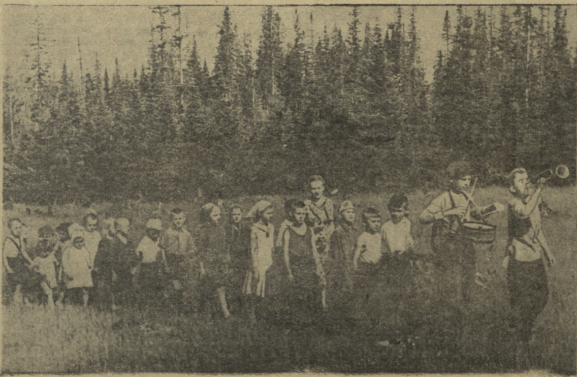
Ребята, отдыхающие на детской площадке, отправились в лес.