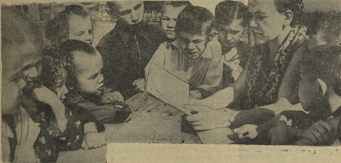
До чего ж интересная книжка!