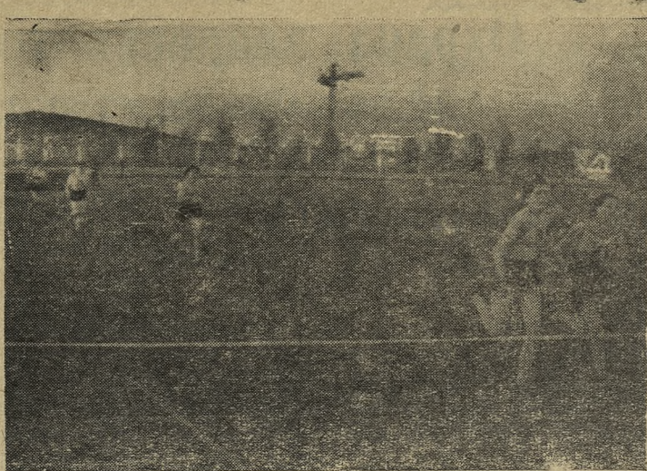
Школьники на беговой дорожке.

Типогр. Облполиграфиздата, г. Первоуральск, ул. Ленина, 75.