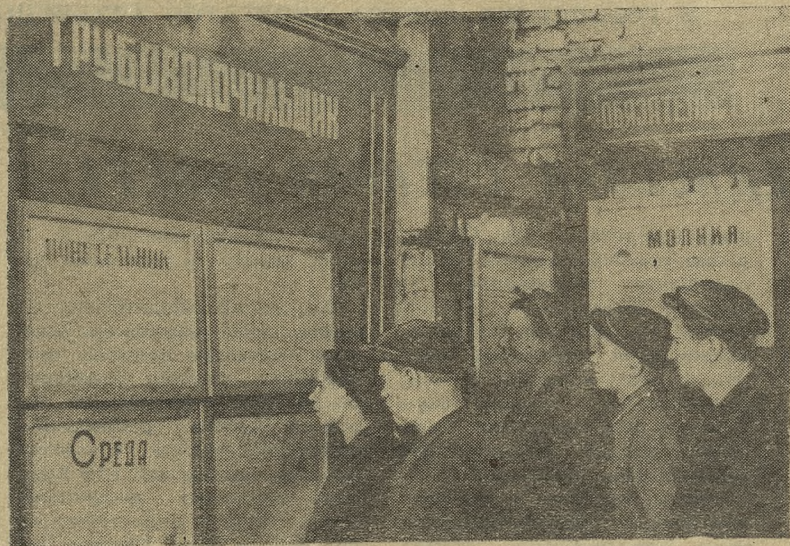
РАБОЧИЕ трубопроводного цеха с интересом просматривают свою ежедневную газету.

*В волоочильном цехе Старотрубного завода выходит ежедневная стенная газета *Наглядная агитация на Динасовом заводе *Когда не выполняются законы о труде