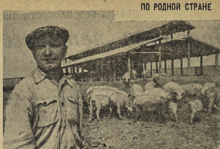
ОДИН ЖИВОТНОВОД ОТКАРМЛИВАЕТ 2 ТЫСЯЧИ СВИНЕЙ

Хотелось, чтобы исполком горсовета потребовал от руководства автохозяйства своевременного выделения автомашин гортопу. К. МИКУШИН.