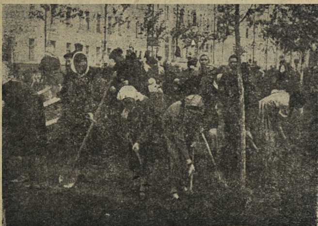
Рабочие цеха № 4 Новотрубного завода за работой.

Художественный фильм «ЗАРЕ НАВСТРЕЧУ» Начало: 5, 7 и 9 час. веч.