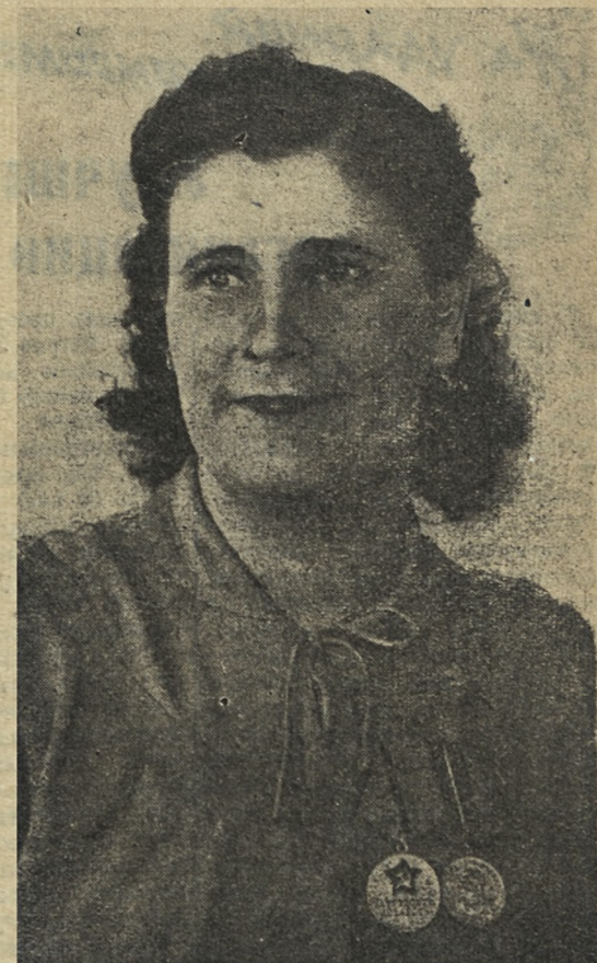
На снимке А. И. Чипиштанова.