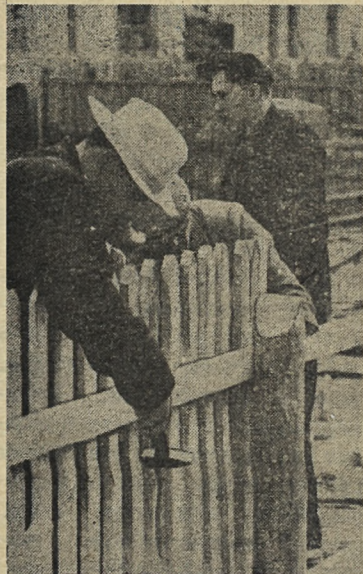
Жители дома № 11 по ул. Ильича устраивают ограду во дворе дома.