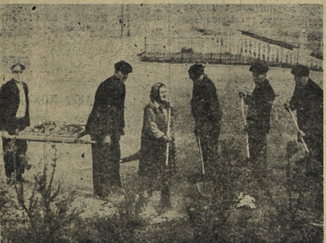
А вот и пенсионеры Новотрубного завода трудятся.