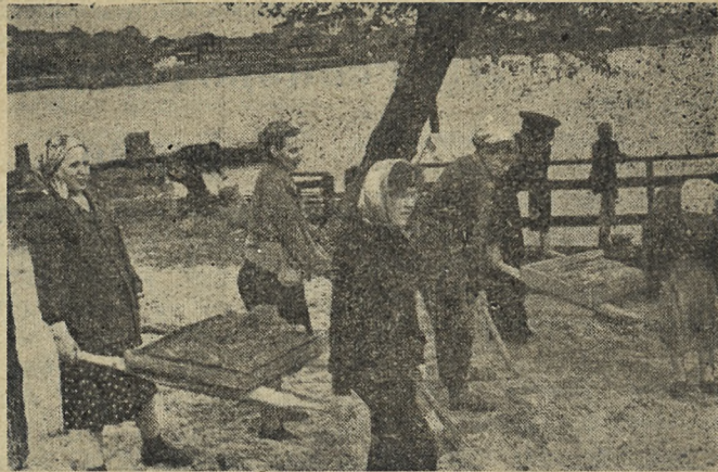
Трубо сварщики Старотрубного завода на водной станции.

Обращаться по адресу: г. Первоуральск, ул. 3-я Красноармейская, дом № 2-а. Отдел кадров.