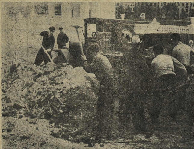
Рабочие цеха № 6 Новотрубного завода на благоустройстве стадиона.

19 АПРЕЛЯ на сессии городского Совета депутатов трудящихся были определены большие работы по благоустройству и озеленению города. Сегодня на очередной сессии городского Совета будут подведены первые