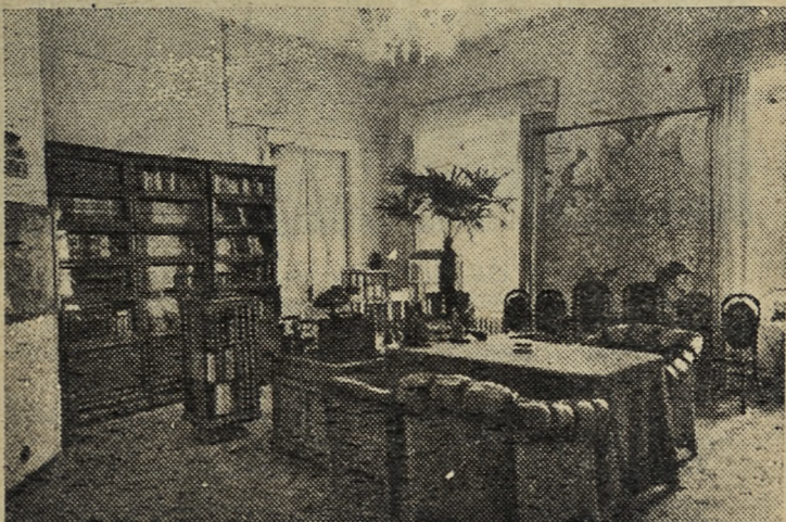
Москва. Кремль. Рабочий кабинет В. И. Ленина.