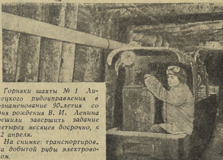
Горняки шахты № 1 Лунецкого рудоуправления в ознаменование 90-летия со дня рождения В. И. Ленина решили завершить задание четырех месяцев досрочно, к 22 апреля.