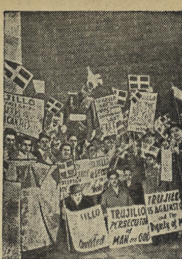
США. Доминиканцы-эмигранты, живущие в Нью-Йорке, устроили недавно демонстрацию протеста против Трихильо, осуществляющего в Доминиканской Республике антинародную военную диктатуру.

Организм ребенка не обладает запасом витамина «Д». При отсутствии его в пище кости ребенка теряют известность и размягчаются — ребенок заболевает рахитом. Особенно витамин «Д» необходим для роста костей и зу-