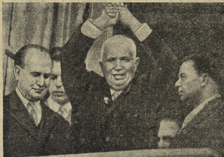
Председатель Совета Министров СССР Н. С. Хрущев в Париже.