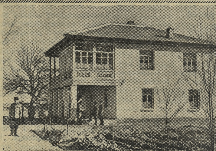
УЗБЕКСКАЯ ССР. За последние годы в колхозе имени Карла Маркса Шахриябского района Сурхан-Даргинской области построено много жилых домов, две средние и начальная школы, медицинский пункт, столовая, магазин, гостиница и другие культурно-бытовые учреждения.

На снимке: новая колхозная гостиница.