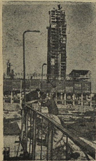
ЧЕЧЕНО . ИНГУШСКАЯ АССР. В Грозном завершается строительство установки непрерывного контакта коксования (Г-18).