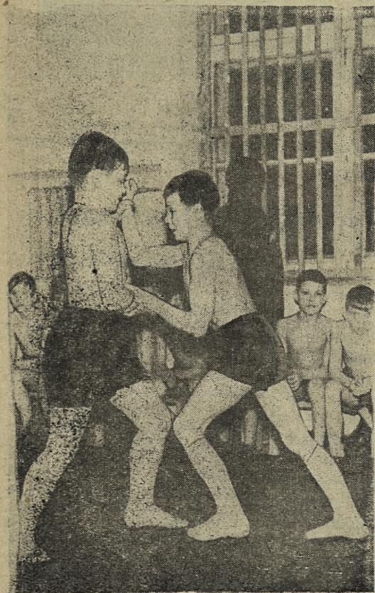
Ребята волнуются: кто победит?

Хористы сейчас готовят интересный репертуар. В программе — песни советских композиторов — Мурадели, Александрова, Фрадкина, польская народная песня «Кася». Коллектив здесь дружный, спаянный. «Давно уже спелись», — шутят ребята. Только вот, к великому сожалению, ре- бат-то в хоре маловато. Вот и