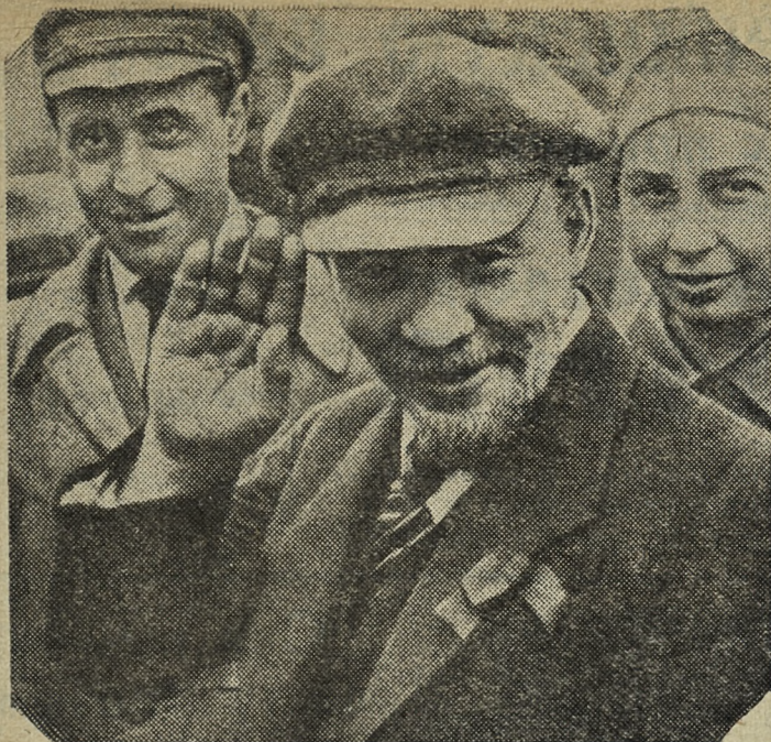
В. И. Ленин на закладке памятника «Освобожденный труд». Москва, 1 мая 1920 года (кинокадр). (Из альбома, подготовляемого к выпуску Институтом марксизма-ленинизма при ЦК КПСС).