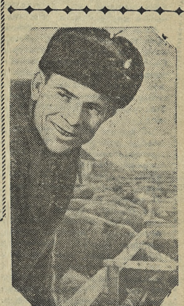
О нем говорили на Пленуме ЦК КПСС

Праздник в 16-й школе начнется с шествия к памятнику Ленину, где будут возложены цветы. Шефы школы вручат пионерам знамя. В этот же день три отряда октябрят будут приняты в пионеры.